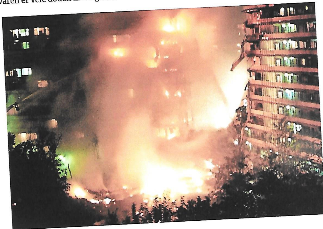
De vuurzee in de Amsterdamse Bijlmer.

Op de zondagavond dat de Boeing de Bijlmerflats binnen vliegt, is Dekker net met - toen nog - zijn vriendin terug van een wandeling. Ze willen gaan eten. „Mijn moeder belde, dat we het journaal moesten kijken. Er was iets verschrikkelijks gebeurd. Bij het zien van de beelden, trok ik lijkbleek weg. Het enige positieve was dat het geen passagierstoestel betrof. Dan waren er vele doden meer gevallen.”